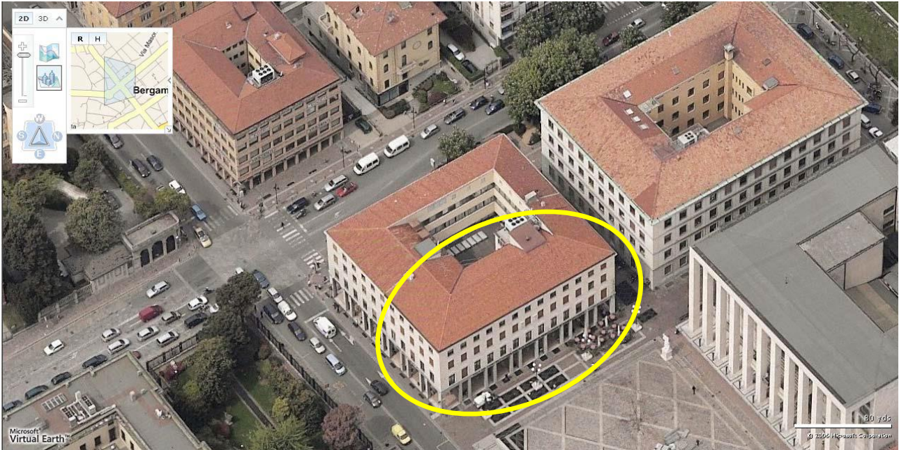
Vista aerea del Palazzo dei Contratti e delle Manifestazioni

L'edificio, libero su tre lati, è caratterizzato da una forma regolare a parallelepipedo rettangolare ed è costituito da quattro piani fuori terra, oltre piano copertura ed interrato. Le maniche del fabbricato si sviluppano intorno ad una corte interna, la pianta del complesso è di forma quadrata e la pianta della porzione di proprietà dell'Ente è a forma di C. L'accesso, esclusivamente pedonale, è previsto dall'ingresso in Via Zilioli, da Piazza Libertà e per le Sale conferenze da Via Petrarca.