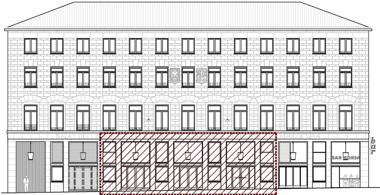
Area oggetto di valorizzazione - prospetto su Piazza Libert 