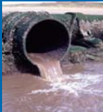
corpo idrico superficiale